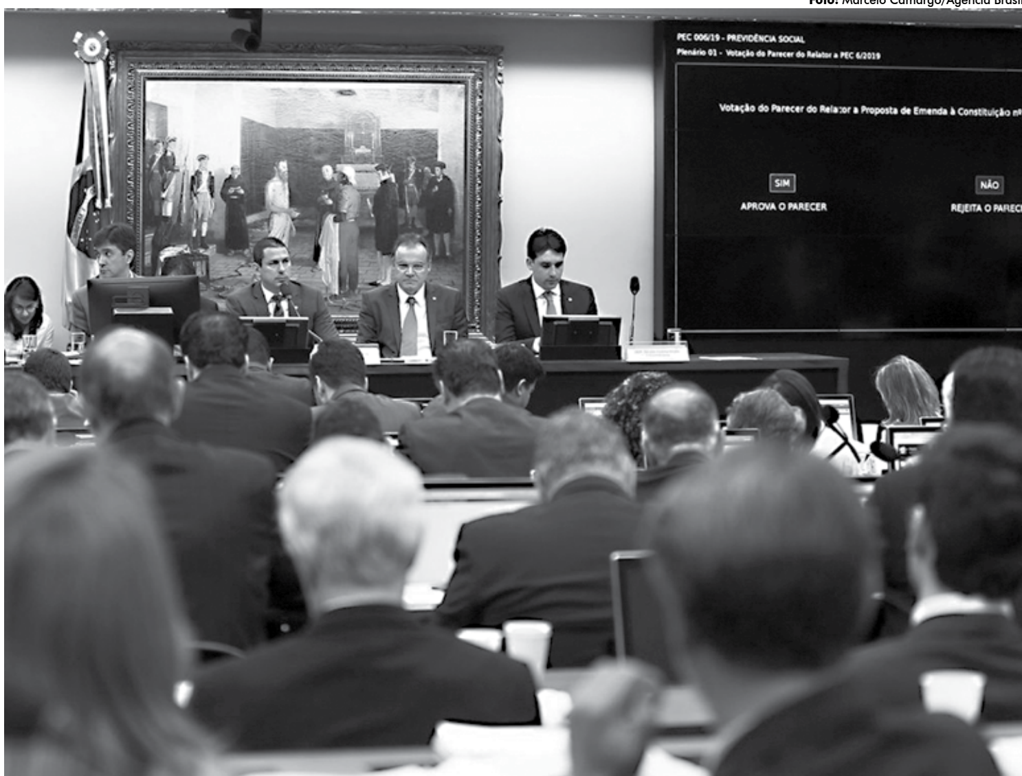
A comissão especial deixou fora estados e municípios do texto-base da reforma da Previdência, mas poderá reincluí-los durante a votação no plenário

Principal ferramenta para elevar a arrecadação da seguridade social e cobrir parte do rombo da Previdência, o aumento da Contribuição Social sobre o Lucro Líquido (CSLL) de 15% para 20% será restrito a bancos médios e grandes. A modificação constou do novo voto complementar do relator da reforma da Previdência na comissão especial da Câmara. O texto anterior, lido na terça-feira (2), previa que a elevação da alíquota valeria para todas as instituições financeiras, exceto a B3 (antiga Bolsa de Valores de São Paulo). As cooperativas de crédito haviam sido beneficiadas com aumento menor, para 17%.