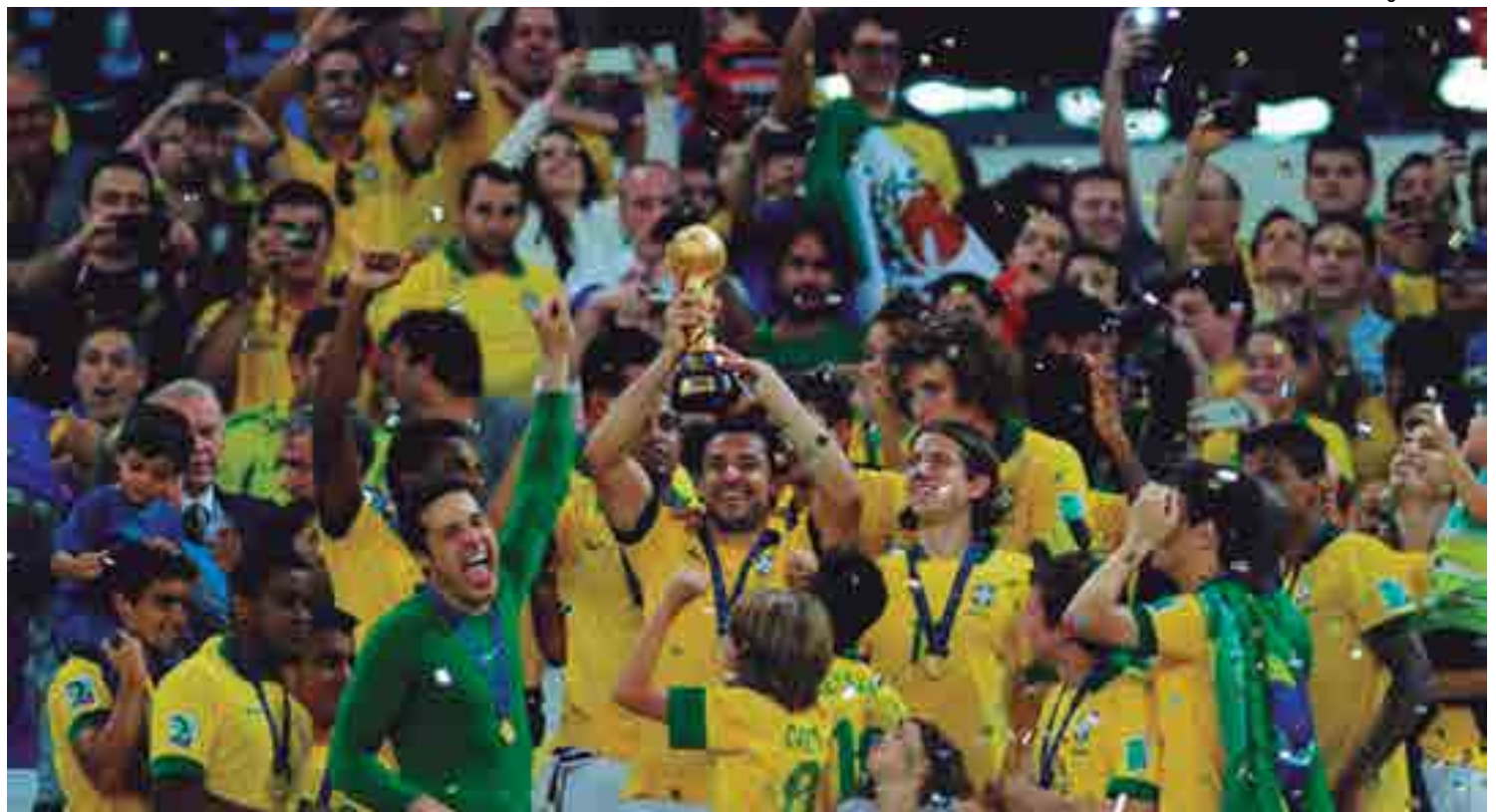
Jogadores comemoram no Maracanã a conquista da Copa das Confederações, a última vez que a seleção se exibiu no Estádio. Retorno será no domingo

“Chego com tranquilidade, sabendo que é uma exposição muito grande. Mas com paz, de seguir na mesma preparação, pedindo para os atletas buscarem recuperação”