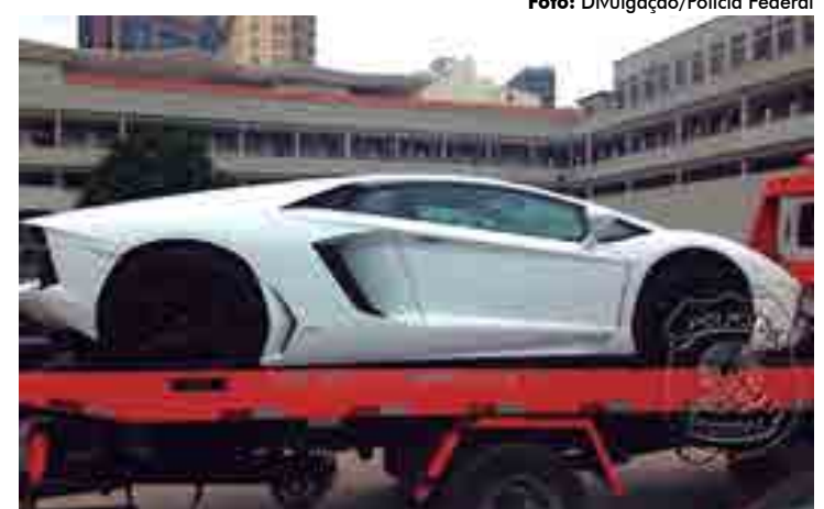
Embora não tenha recebido oferta de compra, o Lamborghini foi o item mais visitado