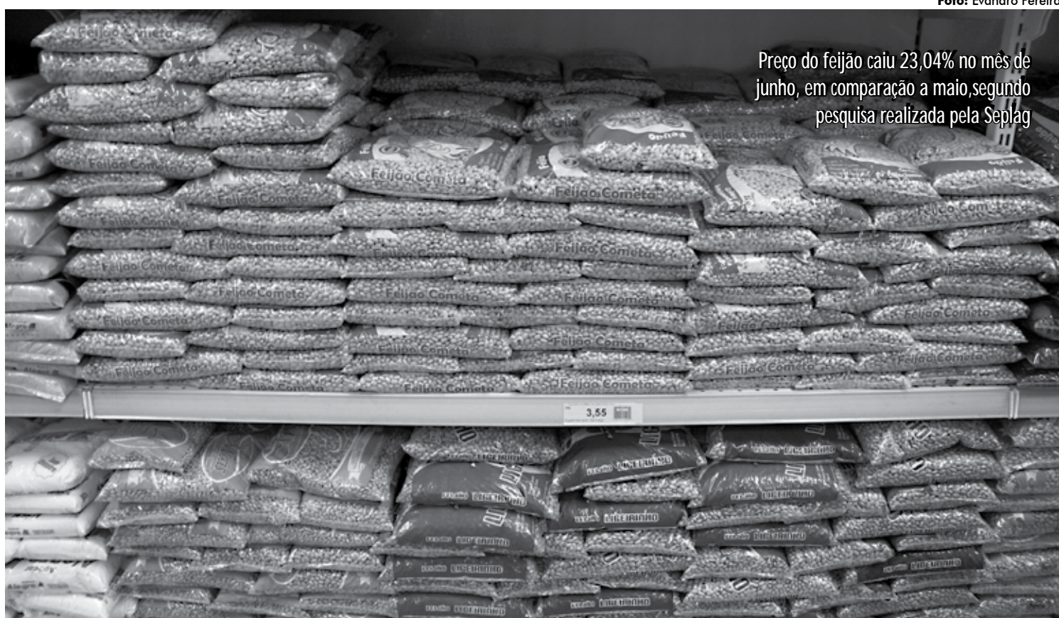
Preço do feijão caiu 23,04% no mês de junho, em comparação a maio, segundo pesquisa realizada pela Seplag

Essa queda no custo da cesta básica de junho é consequência da redução de preços médios registrados nos seguintes produtos: feijão (23,04%); legumes como abóbora, beterraba, batata-inglesa, cenoura e tomate (7,05%); café moído (5,78%); raízes entre as quais inhame, batata-doce e macaxeira (2,41%); farinha de mandioca (0,60%); e óleo de soja (0,25%).