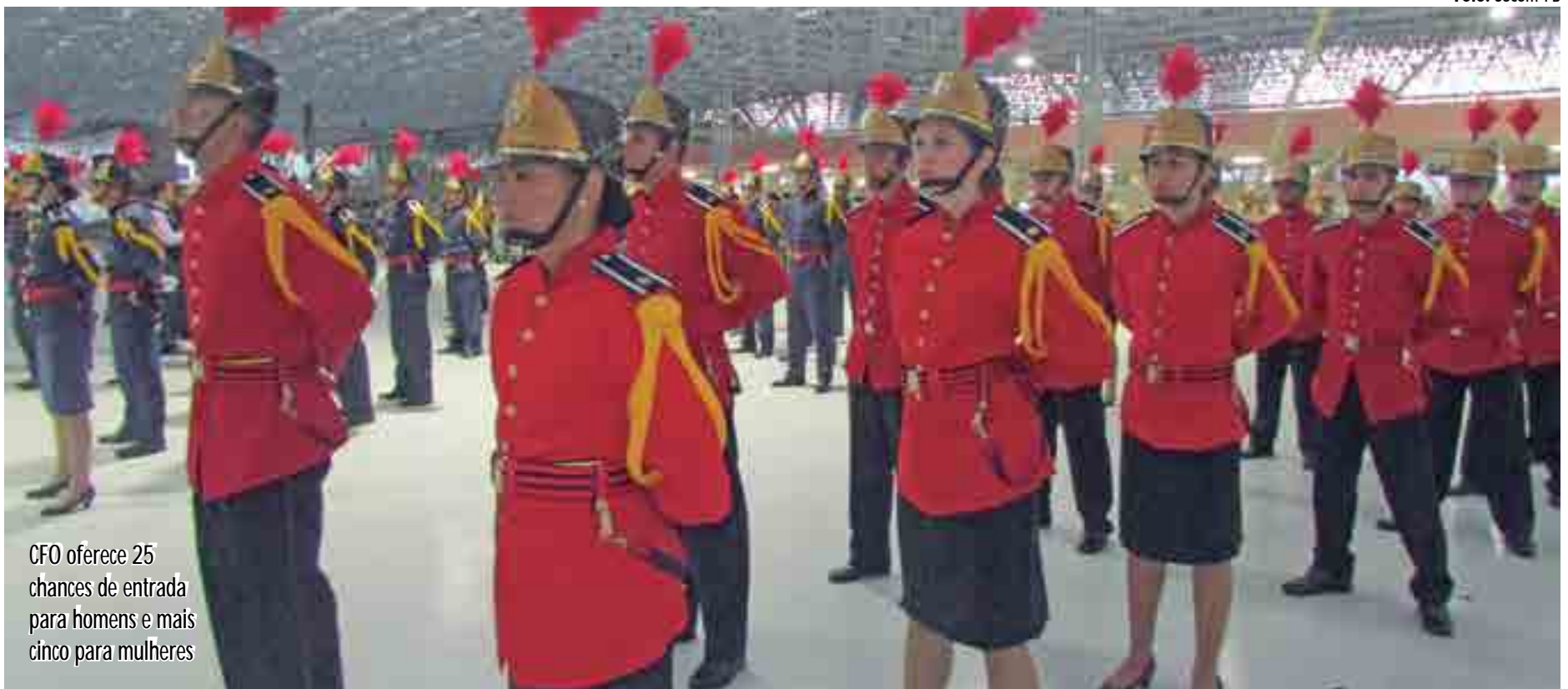
CFO oferece 25 chances de entrada para homens e mais cinco para mulheres

As vagas da Marinha se dividem entre Corpo Auxiliar de Praças (90), Escola Naval (106) e Praça Armada (30)