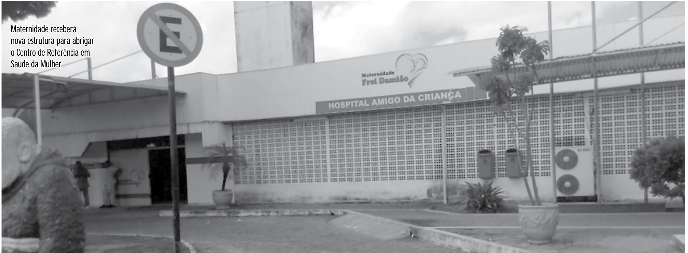
Maternidade receberá nova estrutura para abrigar o Centro de Referência em Saúde da Mulher