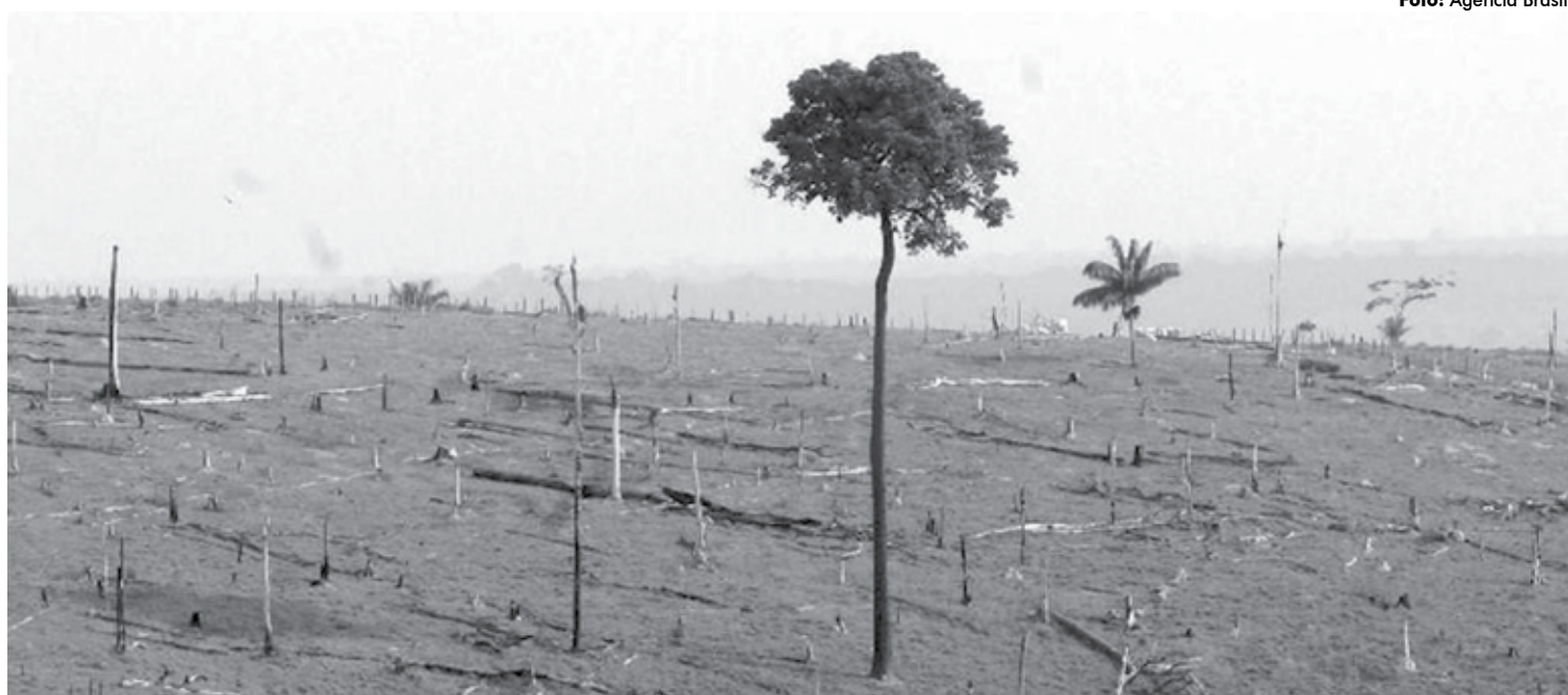
O reflorestamento é a solução mais poderosa se quisermos alcançar o limite de 1,5 grau, segundo o cientista e ecólogo britânico Thomas Crowther

Desde o início da atividade industrial, a humanidade produziu um excedente de carbono na atmosfera de 300 bilhões de toneladas de carbono. De acordo com os pesquisadores, caso esse montante de árvores seja plantado, quando atingirem a maturidade conseguirão absorver 205 bilhões de toneladas de carbono. "Os 300 bilhões de toneladas extra de carbono na atmosfera existentes hoje são devidos à atividade humana", diz o cientista. "O reflorestamento reduziria dois terços disso. Contudo, há um total de 800 bilhões de toneladas de carbono na atmosfera, 500 bilhões das quais naturais."