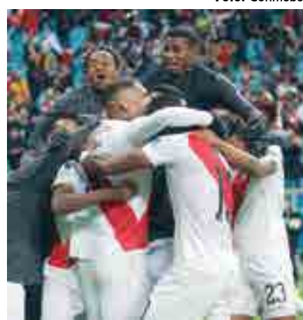
Peruanos fazem festa na Arena do Grêmio

A revanche é um prato que se come frio - e o clima em Porto Alegre contribuiu para isso, com as temperaturas caindo abaixo dos 10 graus conforme a noite avançou nesta quarta-feira, 3. E também com requintes de crueldade, por que não? Depois de Aránguiz perder a primeira das (poucas) chances chilenas, Flores apareceu como surpresa na área para desviar e mudar completamente o diagrama de forças na Arena do Grêmio.