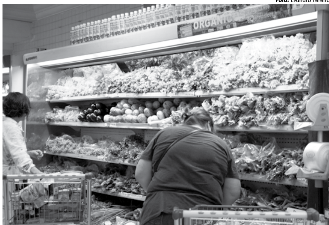
Valor do repolho verde apresenta uma diferença de até 162,29% entre os estabelecimentos pesquisados

Além do repolho, as maiores diferenças nos preços dos hortifrutigranjeiros ficaram com o quilo do inhame, R$ 7,51, com preços de R$ 5,39 (Pão de Açúcar - Epitácio Pessoa) a R$ 12,90 (Hiper Bompreço - Bessa); maracujá, R$ 5,20, com preços de R$ 5,99 (Manáira - Manáira) a R$ 11,19