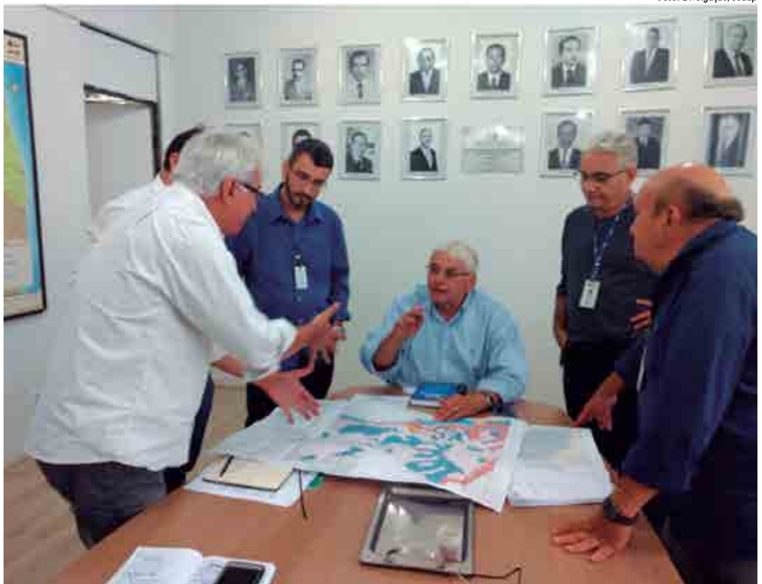
Efraim Moraes secretário de Estado do Desenvolvimento da Agropecuária e da Pesca recebeu a equipe de pesquisadores da Embrapa Solos

O detalhamento das características do solo vai nortear e facilitar o trabalho dos agricultores, beneficiando diversos produtores, tanto da Agricultura Familiar como os de médio e de grande porte. A intenção é colocar os resultados do zoneamento à disposição do público, através da internet.