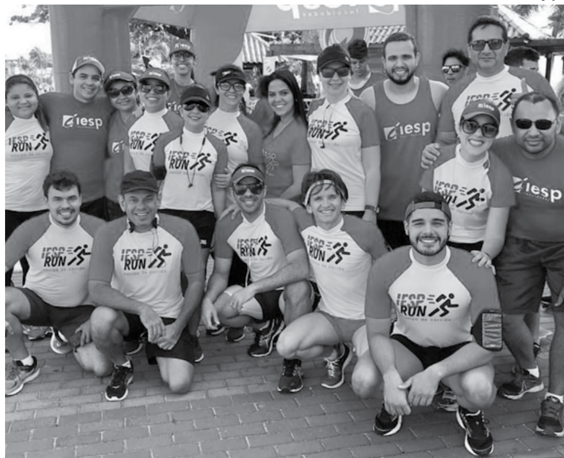
O grupo de corrida IESP Run iniciou no ano passado e no próximo dia 13 comemora o sucesso do evento

do IESP e participante do grupo IESP Run, essa data é fundamental e já marca o sucesso das competições nas ruas "Com um ano, hoje a equipe é respeitada pelo mundo da corrida e atuante. O IESP como instituição apoia diversos eventos esportivos, principalmente corridas de rua e o grupo IESP Run foi o precursor desse envolvimento com a corrida. Não poderíamos deixar passar em branco uma data tão significativa. Sabemos que essa atividade física só tem nos trazido saúde e benefícios", comentou.