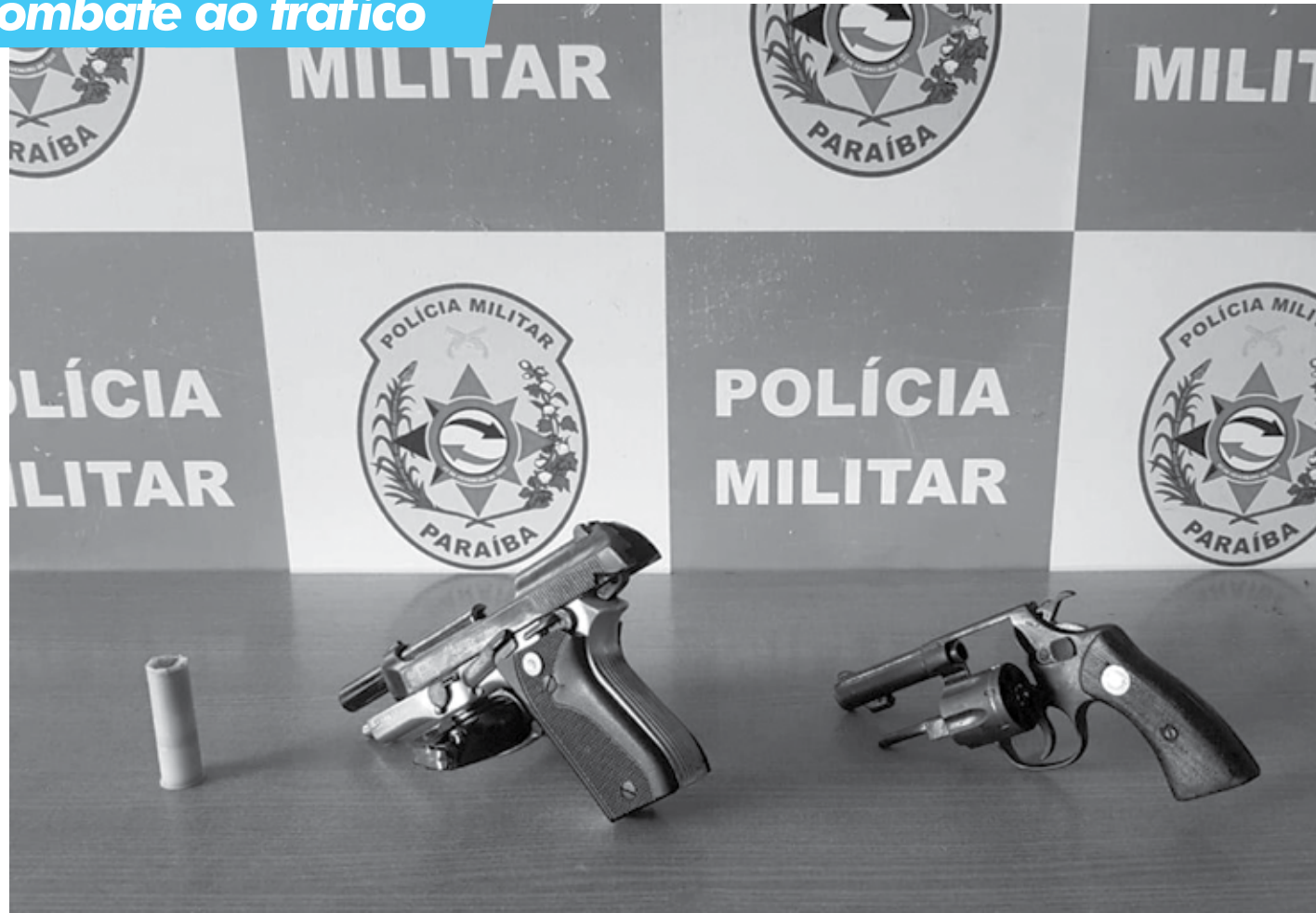
Uma pistola e um revólver estavam guardados numa casa, no bairro de Oitizeiro, onde um suspeito de 20 anos foi preso em flagrante